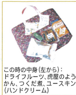
この時の中身(左から): ドライフルーツ、虎屋のよう かん、つくだ煮、ユースキン (ハンドクリーム)