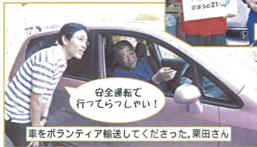
安全運転で 行ってらっしゃい!